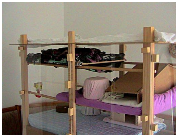
Residencia de vacaciones con mobiliario

Para la sujeción del suelo he usado herrajes normales que se montan con imanes Q-40-10-05-N ( www.supermagnete.it/spa/Q-40-10-05-N ). Hoy lo habría hecho algo diferente: colocando imanes en los lados del suelo en vez de usar herrajes. Los imanes del tipo Q-15-15-08-N ( www.supermagnete.it/spa/Q-15-15-08-N ) serían suficiente en este caso.