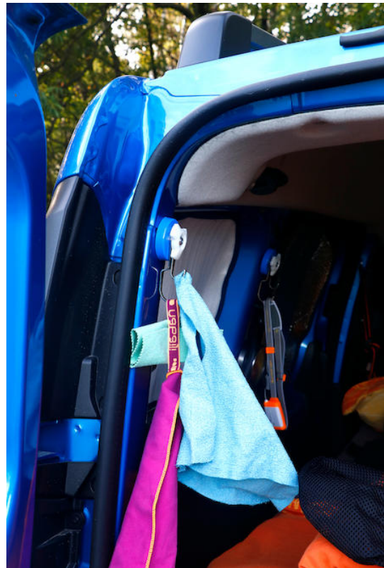
Un gancio magnetico diventa un portasciugamani

In un camper i ganci magnetici doppi ( www.supermagnete.it/M-90 ) sono davvero pratici come portasciugamani. Permettono di creare in un batter d'occhio un posto fisso per gli asciugamani, senza dover forare l'amato furgoncino o i mobili. Proprio in uno spazio così piccolo è fantastico che certe cose, come gli asciugamani, abbiamo il loro posto fisso. Da un lato, tutto resta più ordinato e, dall'altro, gli asciugamani sono sempre a portata di mano quando sono necessari. Un altro vantaggio è che gli asciugamani si asciugano meglio se sono attaccati ai ganci.