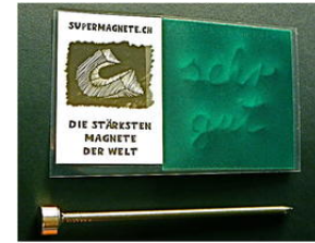
Flux-Detektor als Datenträger

Und viele Datenexperten behaupten sogar, dass die Lebensdauer von Datenbändern und Festplatten die von selbst gebrannten CDs und DVDs deutlich übertreffen wird.