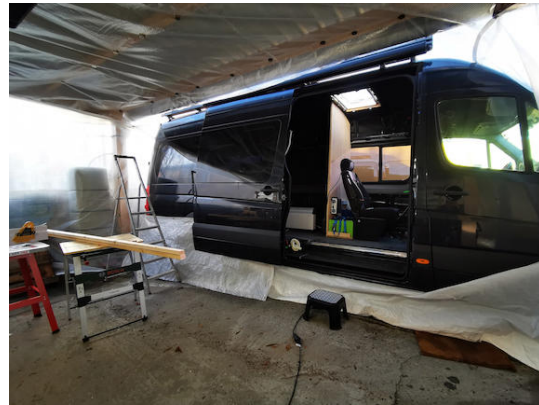
Fixation sur la voiture et aux bords de la bâche : ITNG-40 - aimants en pot caoutchoutés avec filetage intérieur M6 ( www.supermagnete.it/fre/ITNG-40 )