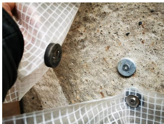
Au sol et à l'entrée, j'ai utilisé 2 rondelles zinguées d'une épaisseur de 3 mm (perçage : Ø 11,5 mm) comme contre-pièce pour l'aimant. Malheureusement, supermagnete.it ne vend pas encore des rondelles de cette taille en acier inoxydable ;)