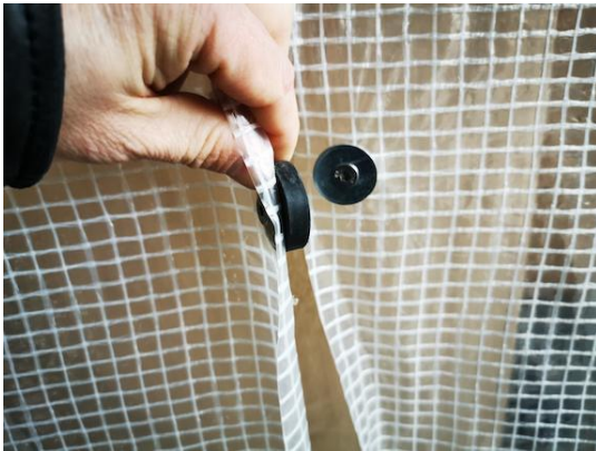
Entrée et fixation sur la voiture : ITNG-32 - aimants en pot caoutchoutés avec filetage intérieur M6 ( www.supermagnete.it/fre/ITNG-32 )

Vous pouvez suivre l'avancement de mes travaux d'aménagement de mes deux vans sur @bigblackbambus ( www.instagram.com/bigblackbambus/ ) et @yellowoftheegg_van ( www.instagram.com/yellowoftheegg_van/ ).