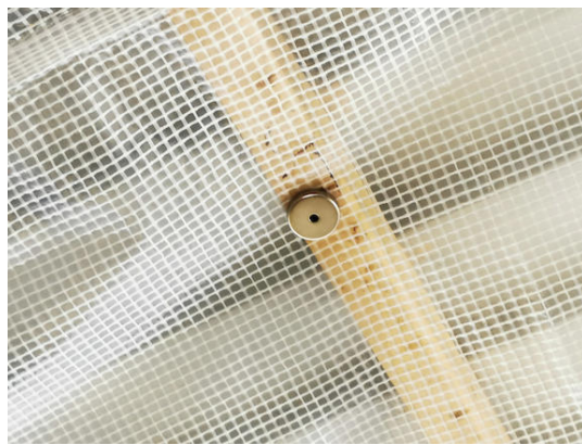
Pour la fixation de la bâche aux surfaces du plafond sont suffisants : CSF-48 - aimants en pot en ferrite avec trou de fixation ( www.supermagnete.it/fre/CSF-48 )