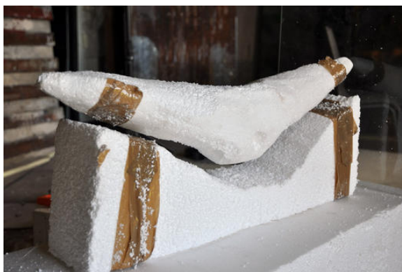
Kunstwerk nog zonder gipslaag - de magneten zijn met plakband bevestigd

Het kunstwerk is door een plexiglas wand aan één uiteinde begrensd, zodat de bewegingsvrijheid wordt beperkt en de levitatie stabiel wordt gehouden.